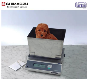
株式会社 島津製作所 分析計測事業部