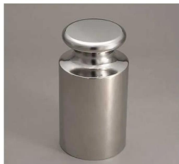
歴史が信頼を生む 大正5年創業の分銅専門メーカー