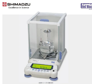
画像は、ロゴマークなどの付いた商品イメージです。