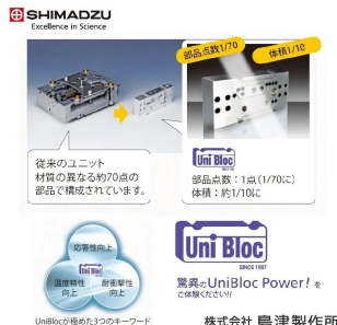
画像は、ユニブロックのイメージです。