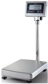
写真は、シリーズ代表画像です。：K L-I S-K 6 0 A-S U S