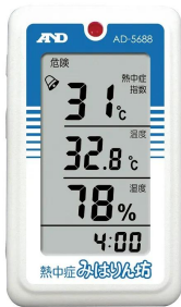
画像は、商品イメージです。