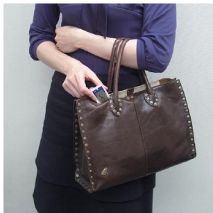
画像は、使用イメージです。