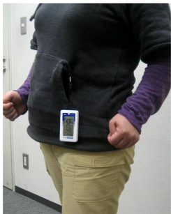
画像は、使用イメージです。