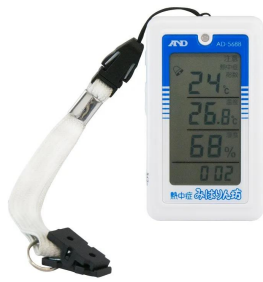
画像は、ストラップを付けたイメージです。