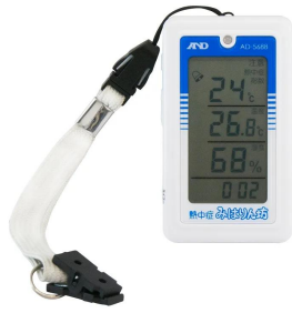
画像は、ストラップを付けたイメージです。