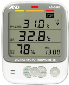
画像は、商品イメージです。熱中症指数表示