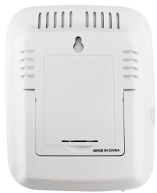
画像は、背面のイメージです。