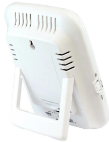
画像は、卓上スタンドのイメージです。