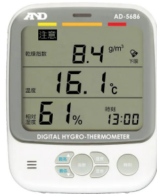
画像は、商品イメージです。乾燥指数表示