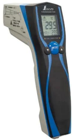
画像は、商品イメージです。