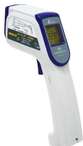
画像は、商品イメージです。