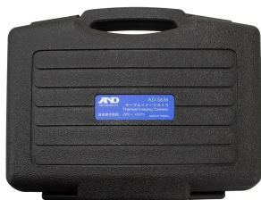
画像は、キャリングケースのイメージです。