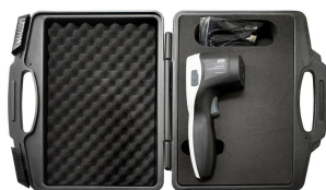
画像は、キャリングケースへの収納イメージです。