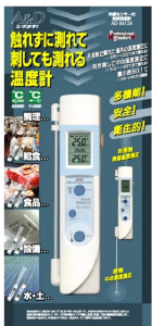
画像は、個包装のイメージです。