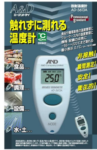
画像は、個包装のイメージです。