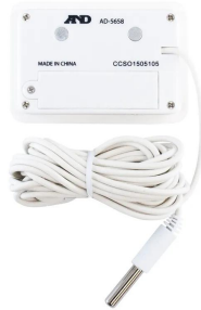
画像は、商品背面のイメージです。