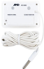
画像は、商品背面のイメージです。