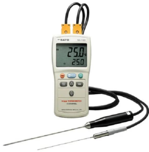
画像は、別売センサSK-K010とSK-K020を取付けた商品イメージです。