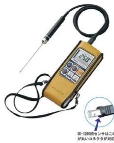
画像は、ソフトケースを取付けたイメージです。