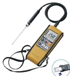
画像は、ソフトケースを取付けたイメージです。