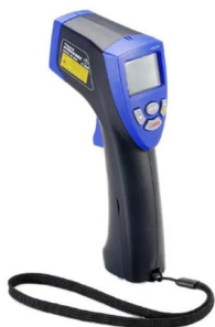
画像は、商品イメージです。