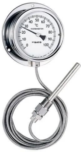
写真は、シリーズ代表画像です。