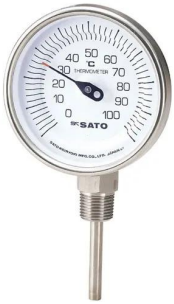
写真は、シリーズ代表画像です。