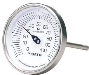
写真は、シリーズ代表画像です。