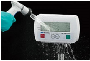
写真は、表示部の洗浄イメージです。