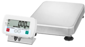
写真は、商品イメージです。