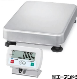
写真は、商品イメージです。