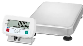
写真は、商品イメージです。