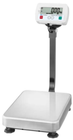
写真は、商品イメージです。