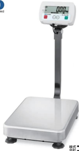
写真は、商品イメージです。