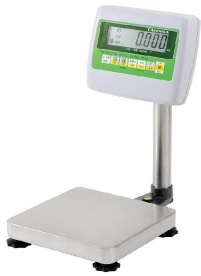
画像は、商品イメージです。