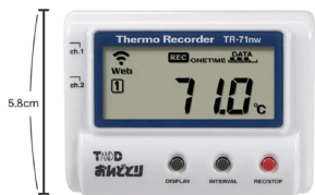
画像は、商品の大きさのイメージです。