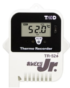
写真は、表示部のイメージです。