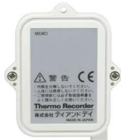
画像は、商品背面のイメージです。