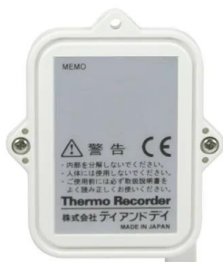
画像は、商品背面のイメージです。