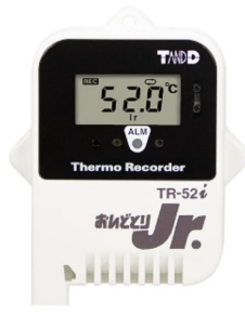
写真は、表示部のイメージです。