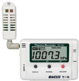
画像は、商品イメージです。