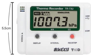
画像は、商品の大きさのイメージです。