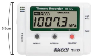
画像は、商品の大きさのイメージです。