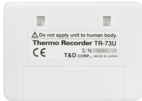
画像は、商品背面のイメージです。