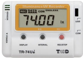
写真は、表示部のイメージです。