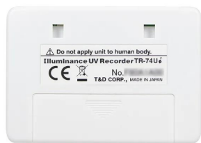
画像は、商品背面のイメージです。