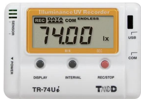
写真は、表示部のイメージです。