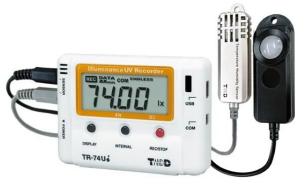
画像は、商品イメージです。