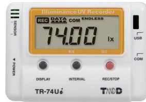
写真は、表示部のイメージです。