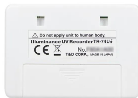
画像は、商品背面のイメージです。