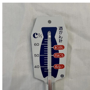
写真は、在庫より抜き取り撮影した商品です。