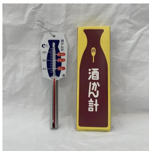
写真は、在庫より抜き取り撮影した商品です。