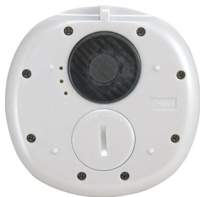
画像は、商品背面のイメージです。