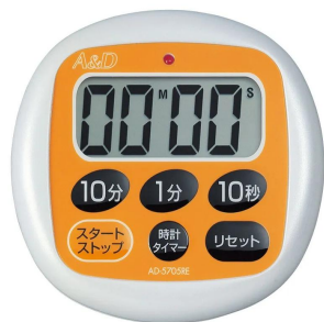
画像は、商品イメージです。