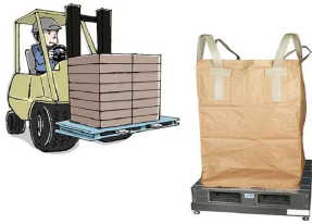
画像は、計量作業のイメージです。