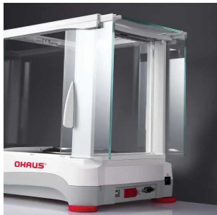
写真は、2段スライド式ドアの開閉イメージです。