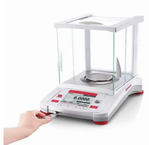
写真は、USBメモリの装着イメージです。