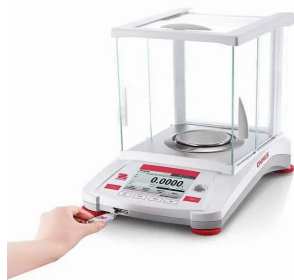
写真は、USBメモリの装着イメージです。