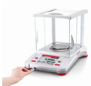
写真は、USBメモリの装着イメージです。