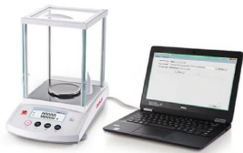
画像は、PC連動イメージです。PC及びケーブルは、別売です。