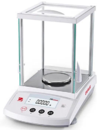
写真は、シリーズ代表画像です。