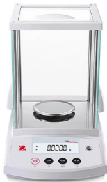
写真は、シリーズ代表画像です。