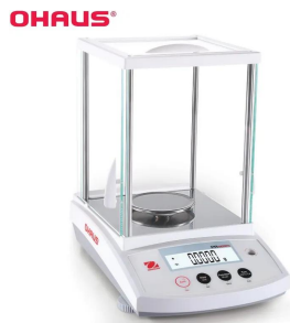
写真は、シリーズ代表画像です。