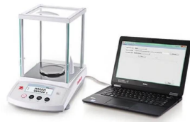
画像は、PC連動イメージです。PC及びケーブルは、別売です。