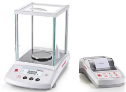
画像は、別売の密度測定キット装着イメージです。

RS-232Cインターフェイス(標準装備)によるデータ転送可能 明るく、読みやすいバックライト付きディスプレイと直感的操作が可能なユーザーインターフェイス 校正分銅内蔵で、カンタン校正