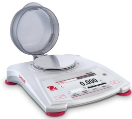
画像は、風防を開けたイメージです。