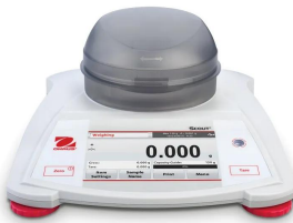
画像は、商品正面のイメージです。