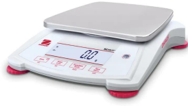
写真は、シリーズ代表画像です。