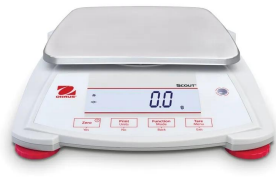
画像は、商品正面のイメージです。