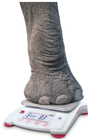
画像は、オーバースケールのイメージです。