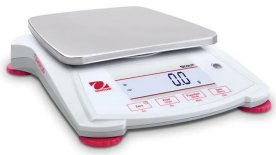
写真は、シリーズ代表画像です。