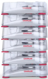
画像は、別売の積み重ね保管用キットを使用したイメージです。