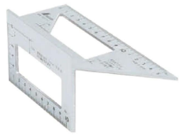
シンワ測定株式会社