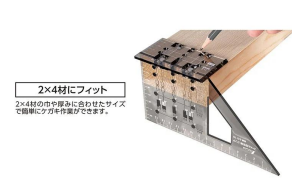
シンワ 測定株式会社 画像は、商品の使用イメージです。