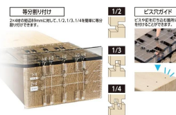
シンワ 測定株式会社 画像は、商品の使用イメージです。