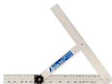
シンワ 測定株式会社 画像は、商品イメージです。