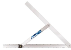
シノワ 測定株式会社 画像は、商品イメージです。