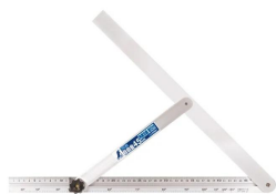
シンワ 測定株式会社 画像は、商品イメージです。