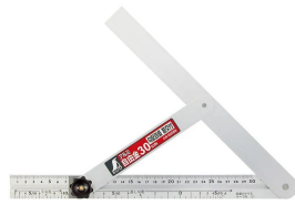
シノワ 測定株式会社 画像は、商品イメージです。