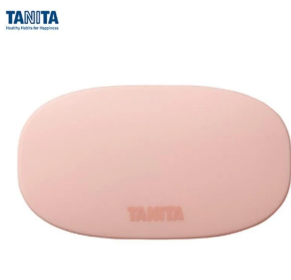
画像は、蓋を閉じたイメージです。