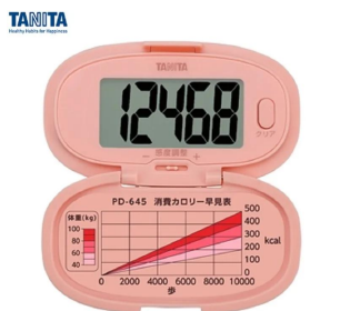
画像は、蓋を開けたイメージです。