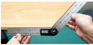
シンワ 測定株式会社 画像は、商品の使用イメージです。