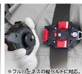
※フルハイスの軽ベルトに対応。