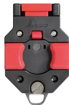
シンワ 測定株式会社 画像は、商品イメージです。