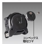
コンベックス 取付コマ

コンベックス取付コマを付けることでマグネットが引きつけ合い、吸い付くように正面から装着できます。