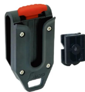
シンワ 測定株式会社 画像は、商品イメージです。