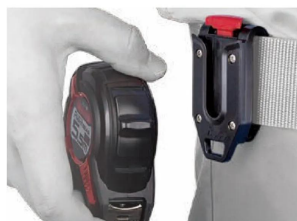
シンワ 測定株式会社 画像は、商品の使用イメージです。