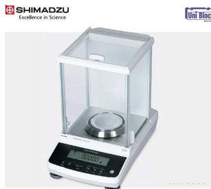
Amidia 株式会社 島津製作所 画像は、ロゴマークなどの付いた商品 イメージです。