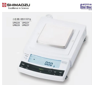
画像は、ロゴマークなどの付いた商品イメージです。