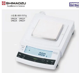
画像は、ロゴマークなどの付いた商品イメージです。