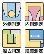
外側測定 内側測定